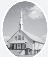
Saint-Robert Bellarmin Tél./Fax : 418 582-3553