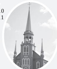
Saint-Théophile Tél./Fax : 418 597-3373

Horaire des messes Dimanche 9 h : St-Gédéon, St-Ludger, St-Théophile Dimanche 10 h 45 : St-Robert, St-Martin