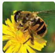
Installation de ruches