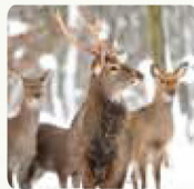
Cerf de Virginie