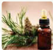
Produits manufacturés et matériaux